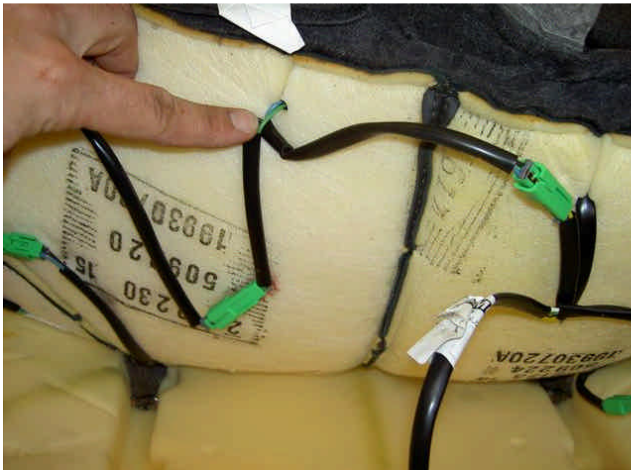
Die Lehne überprüft ihr natürlich auch ! ( grüner Stecker )